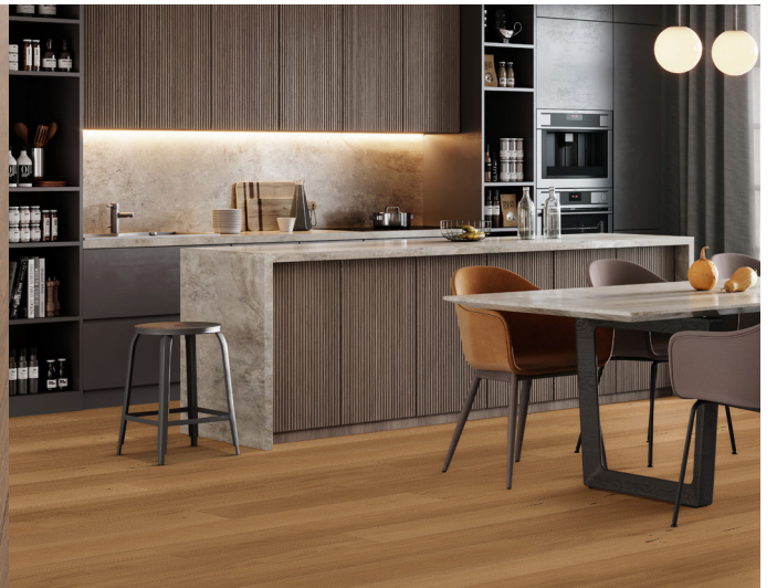
Oak White SR308