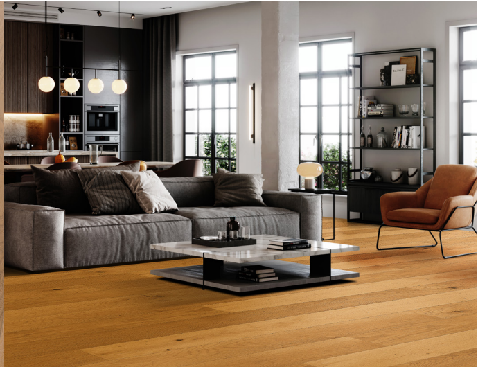
Oak Pure SR101